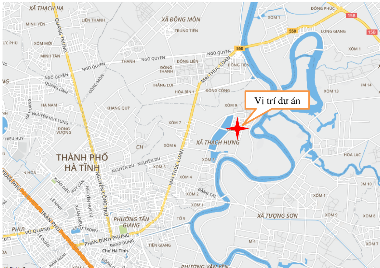
Sơ đồ vệ tinh vị trí thực hiện dự án

Khu vực Dự án thuộc địa bàn xã Thạch Hưng, thành phố Hà Tĩnh, tỉnh Hà Tĩnh.