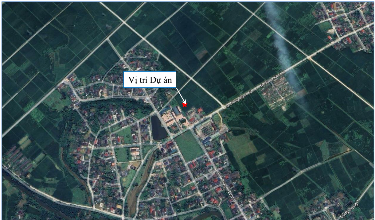
Hình 1.1: Vị trí thực hiện dự án.