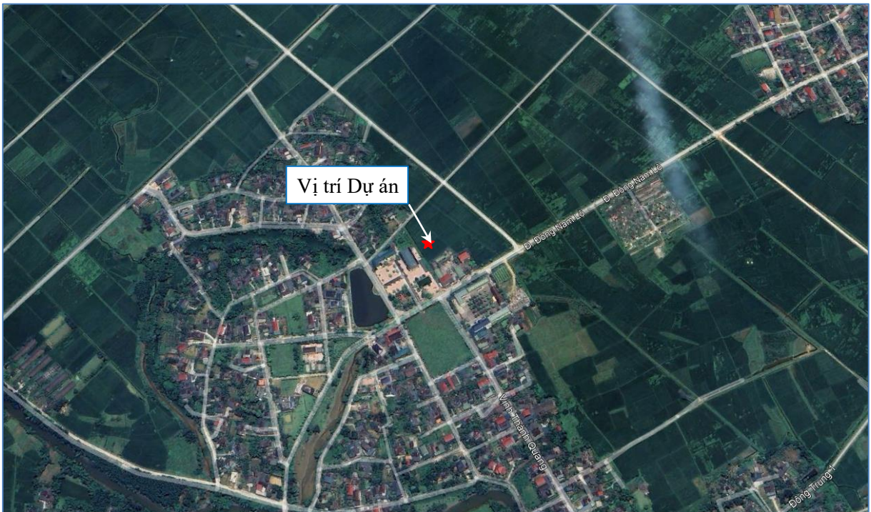
Hình 1.1: Vị trí thực hiện dự án.